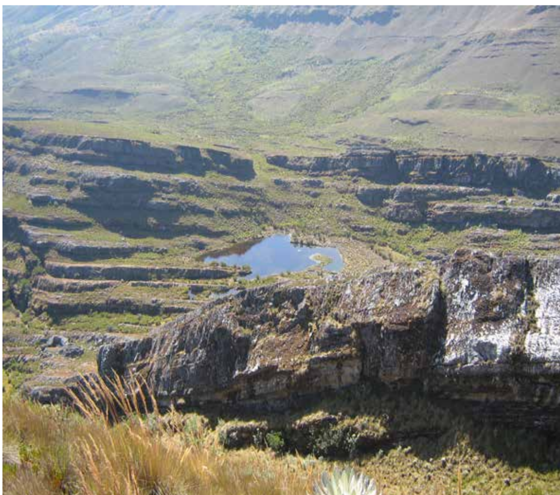
Páramo de Pisba

De los 2.906.000 hectáreas de páramos en Colombia, solo 1 millón conserva su vegetación original, el resto ha sido transformado por actividades humanas como la agricultura y la urbanización, lo cual ha tenido