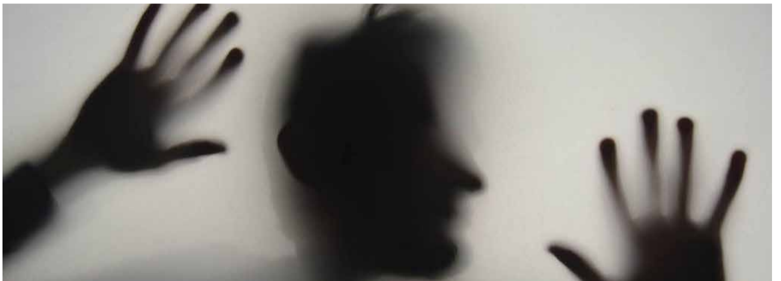
El 80 % de las personas con trastorno bipolar en Colombia no han sido diagnosticadas.

Por más de 70 años la psiquiatría ha utilizado el litio en los medicamentos para tratar trastornos como la bipolaridad, con resultados muy efectivos, ¿por qué?