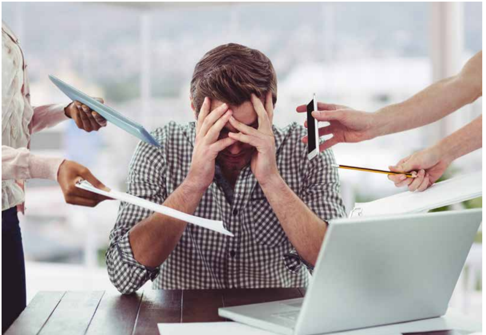
Aumento en los niveles de estrés y ansiedad, son las causas de la polarización

La situación del país por la polarización es creciente, la violencia aumenta cada día en más