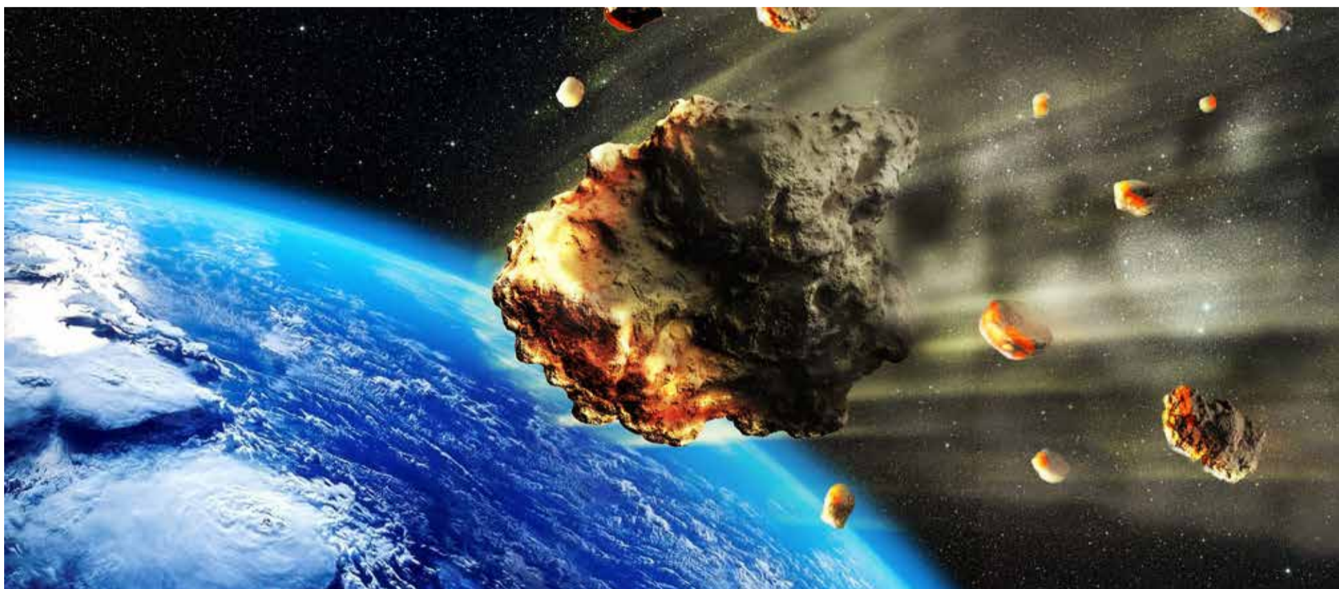
Tiktoker que dice venir del futuro advierte que un meteorito acabará con la mitad de Estados Unidos y que descubrirán vida en otros planetas. Viajero del tiempo, que asegura venir del año 2236, hace advertencias

El sujeto, que se mantiene en el anonimato, afirma que viajó 214 años por el tiempo hasta la época actual. «Soy un verdadero viajero del tiempo del año 2236 y he llegado a una fecha en el tiempo para advertirte sobre los próximos eventos en los próximos años», indicó.