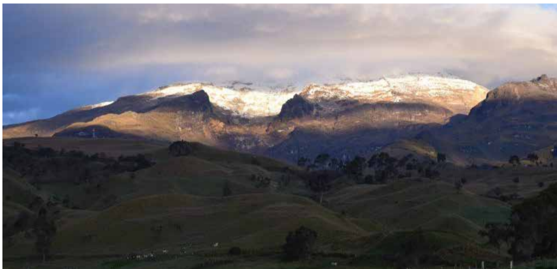
Vista panorámica del Volcán Nevado del Ruiz.

Colombia tiene aún seis nevados, convertidos en centros de atención y visi-