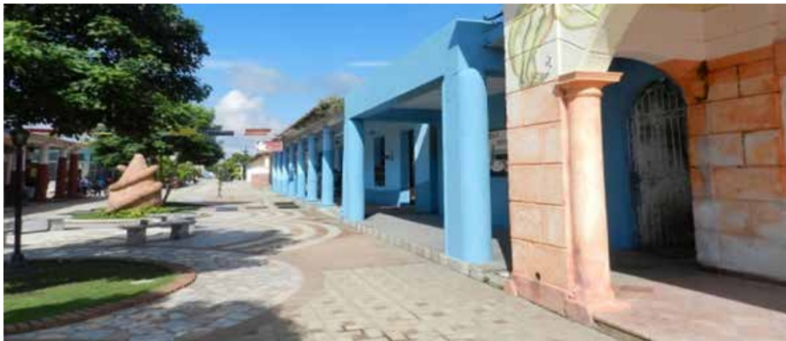
Bienvenidos a mi isla, tu isla, la isla de la juventud

—No pudo llevarme. No me atemorice. Me defendí como pude. Lo apuñalé,