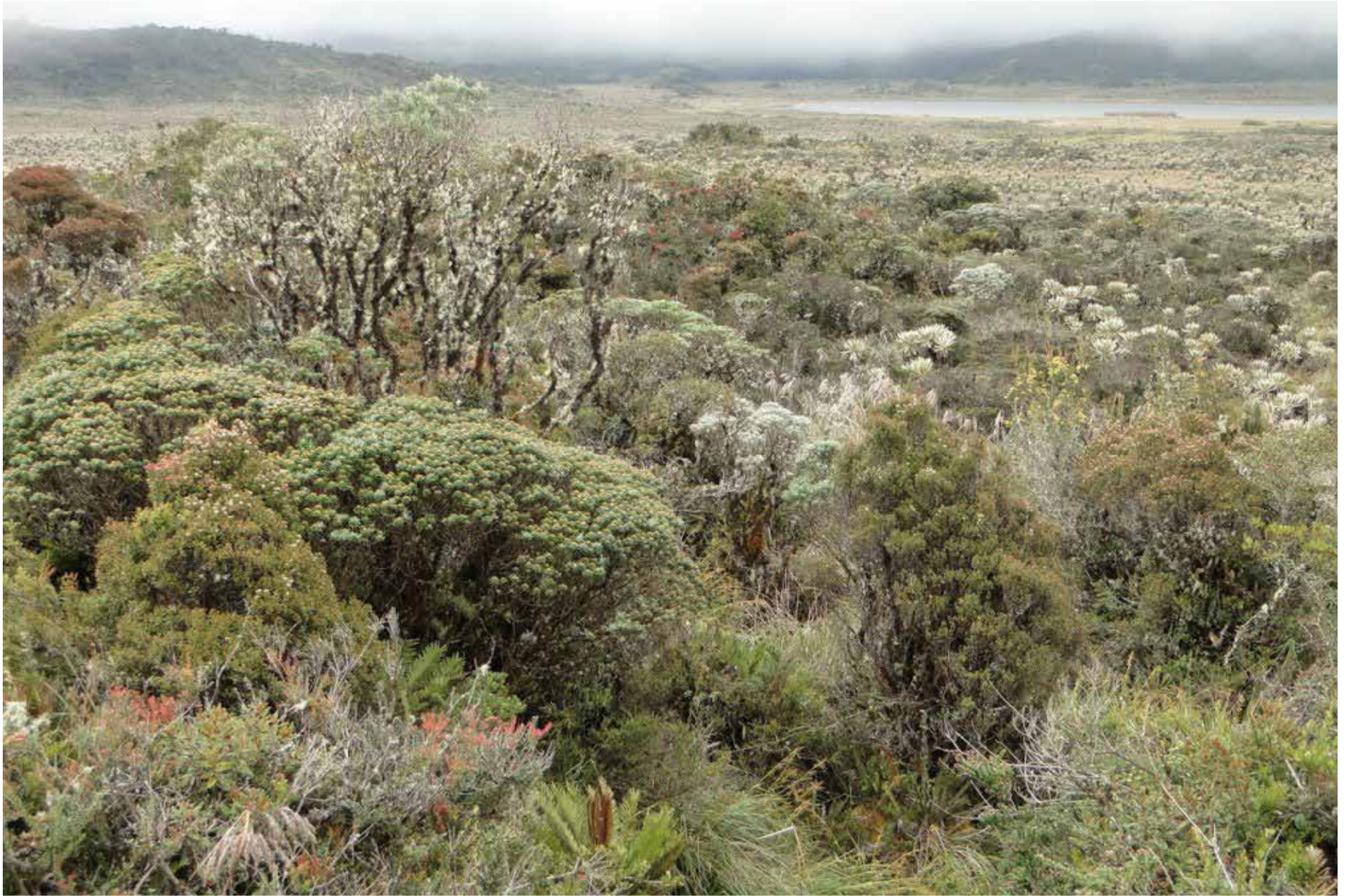
Páramo de Puracé