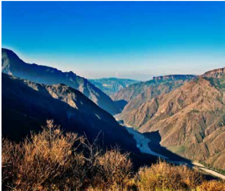
Cañón de Chicamocha

En este artículo se comenta cómo utilizar la caja para esto. Empecemos con la caja manual, donde el control de los cambios lo tiene el conductor.