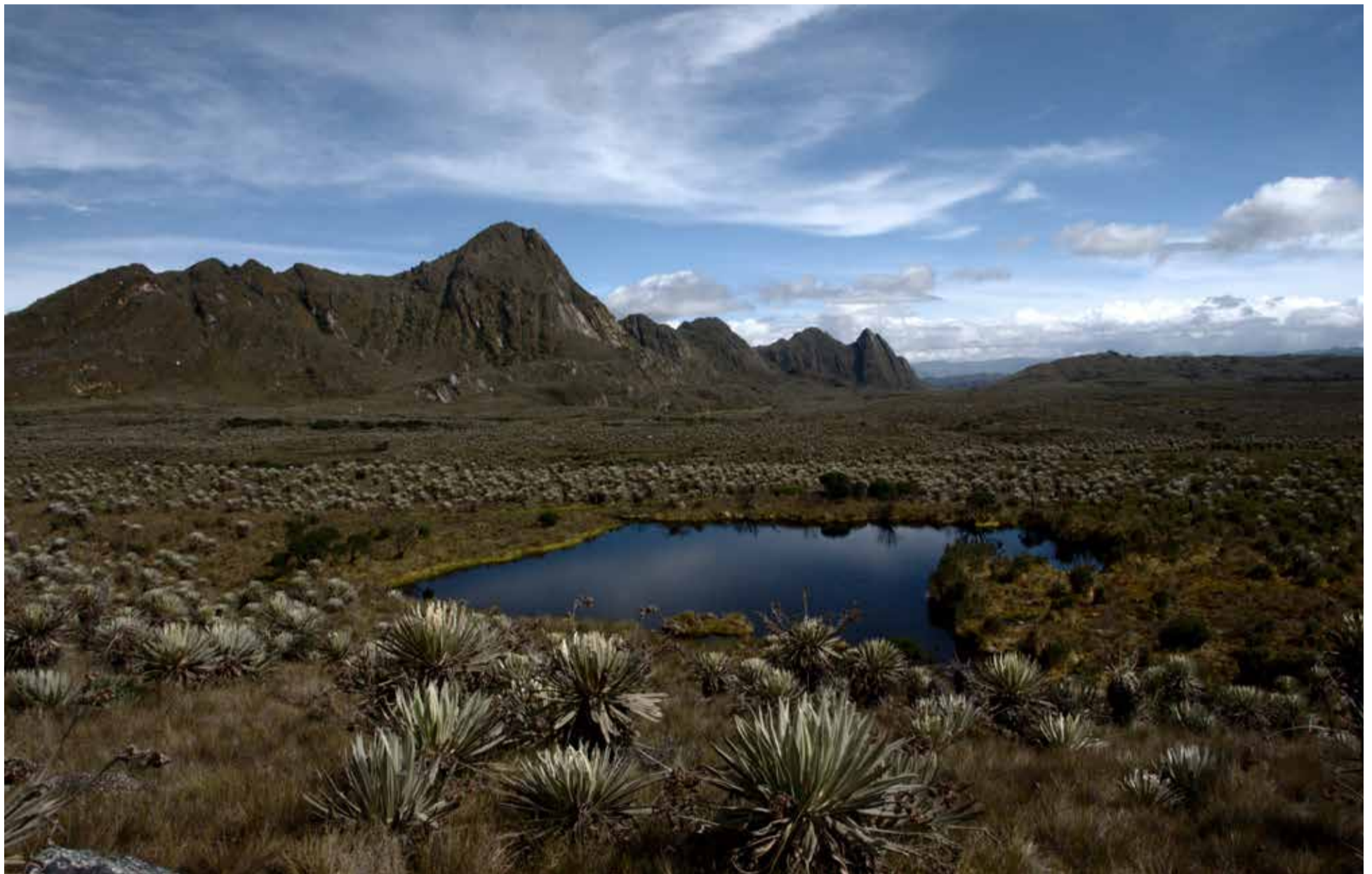
Páramo de Sumapaz