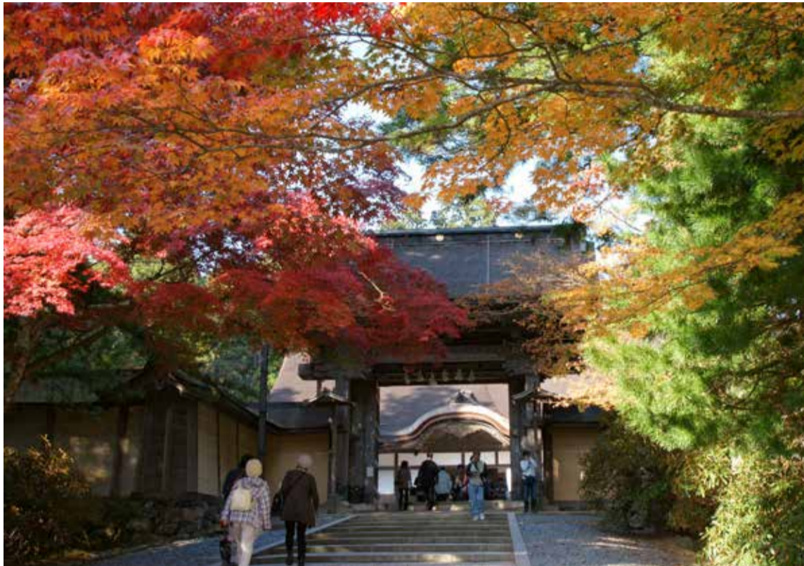
Hojas de otoño (Momiji) en Kong bu-ji, Monte Koya. Declarado Patrimonio de la Humanidad

Durante muchos años el turismo ha sido una industria periférica, llevando a cabo una serie de políticas dirigidas a este