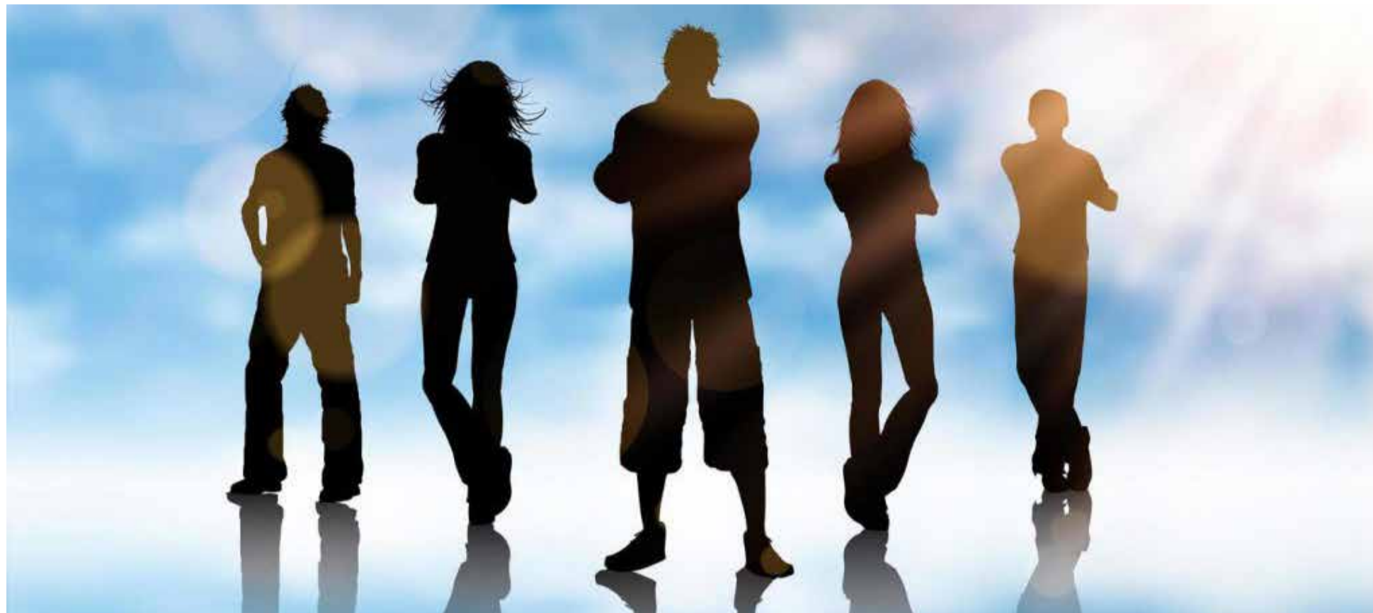
La nueva generación de los narcos: los invisibles.