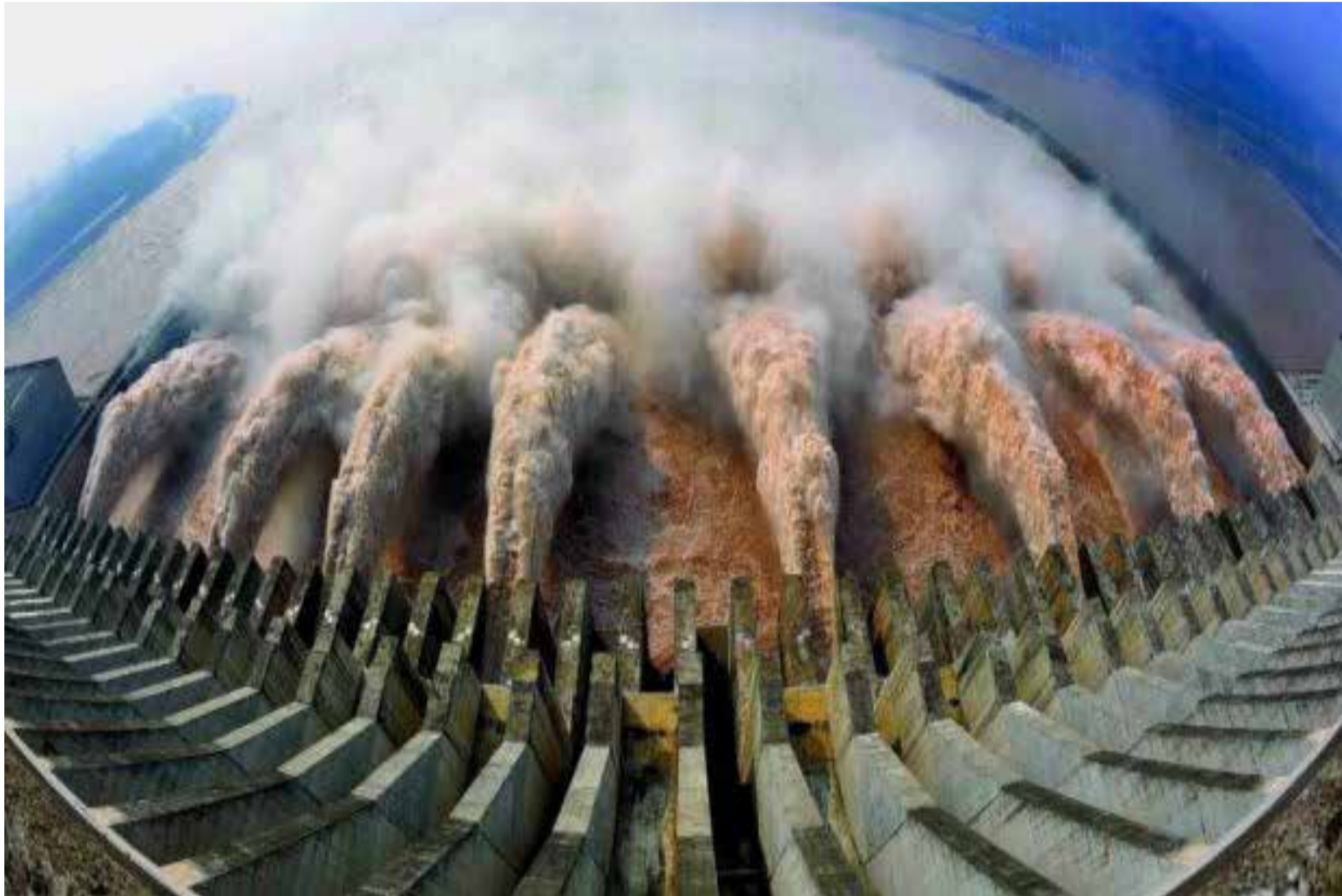
La última exageración convertir ríos en centrales de energía

Convocar a quienes lo eligieron para que salgan a la calle a rechazar el juicio que se está abriendo, no solo es una exageración peligrosísima para la tranquilidad pública que como gobernantes