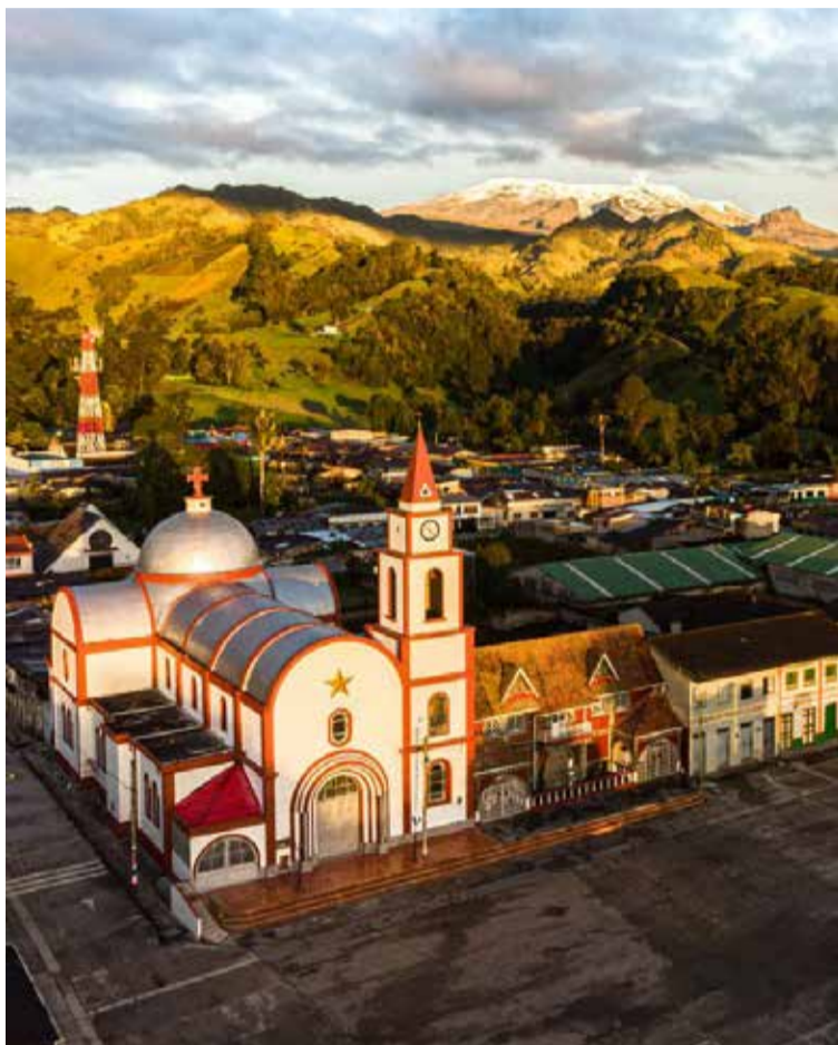
Murillo municipio del departamento del Tolima

Este Viernes Santo en esta población del departamento del Tolima el día fue normal, tanto así que la gente asistió a las celebraciones de la Semana Santa y unas 200 personas acompañaron