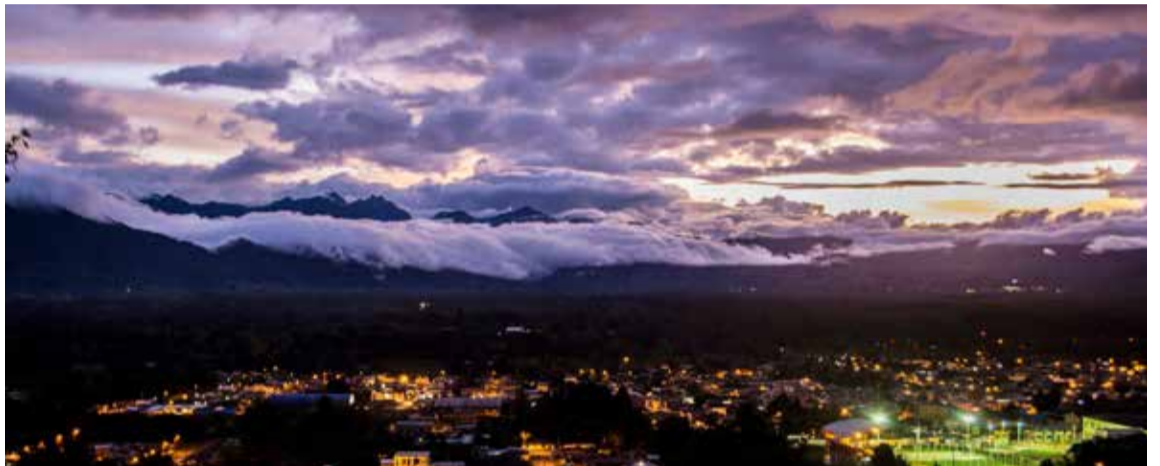
El Valle de Sibundoy es un lugar pluriétnico y multicultural, convergen allí comunidades originarias como los Camentsá, Inga y Pastos, el campesinado y comunidades negras que decidieron cohabitarlo al ver su belleza andino amazónica.

Se otorgó concesiones por 30 años para adelantar trabajos de búsqueda y explotación de oro, platino, zinc, molibdeno, plata y otros metales asociados, en el corredor biológico del Alto Putumayo, lugar donde nacen los ríos Putumayo, Mo-