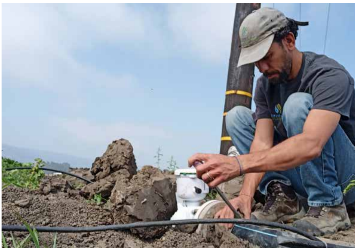
En el RCD, Sacha encontró un terreno fértil para promover la inclusión de grupos demográficos históricamente desfavorecidos y equilibrar múltiples perspectivas al abordar problemas complejos de conservación de recursos naturales.

Los premios se entregaron en la 7.ª Cumbre de Agricultura y Clima que se cumple en Davis, California y se otorgan a personas que han realizado contribuciones sobresalientes en sus campos para acelerar la transición hacia un sistema agrícola saludable, justo y resistente al clima, y que tam-